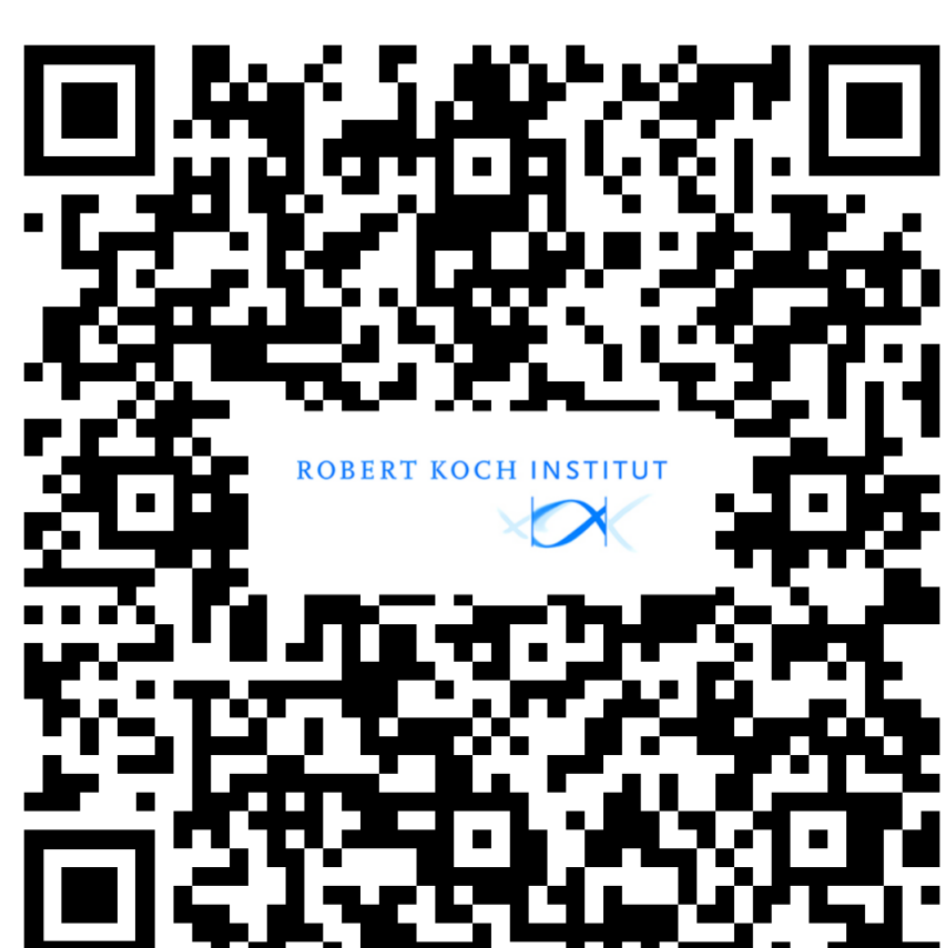
Risikogebiete / risk areas www.rki.de/ncov-risikogebiete

Beachten Sie die Reisehinweise des Auswärtigen Amtes: https://www.auswaertiges-amt.de/de/ReiseUndSicherheit/reise-und-sicherheitshinweise