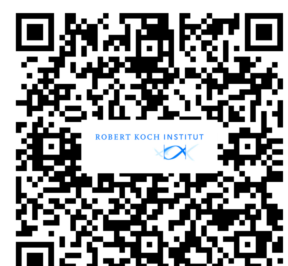
Weitere Informationen RKI