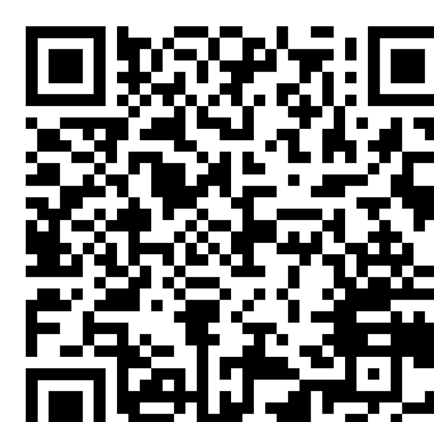
Reisehinweise Auswärtiges Amt

Consideri i consigli di viaggio del Ministero degli affari esteri: https://www.auswaertiges-amt.de/de/ReiseUndSicherheit/reise-und-sicherheitshinweise