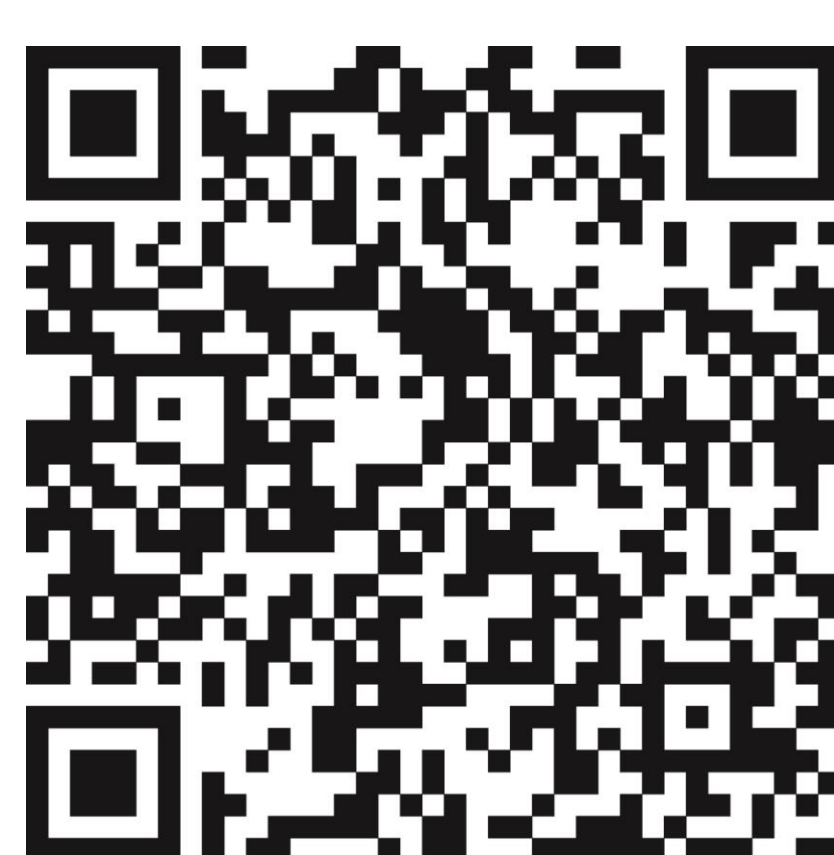
Weitere Informationen BZgA